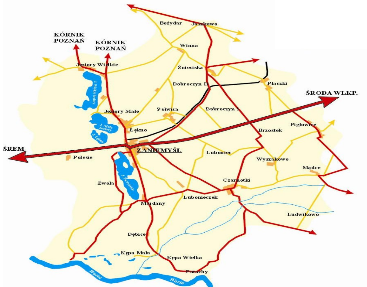
Rysunek 2.1. Położenie wsi Zaniemyśl

Położenie Zaniemyśla w Gminie przedstawia Rysunek 2.1.