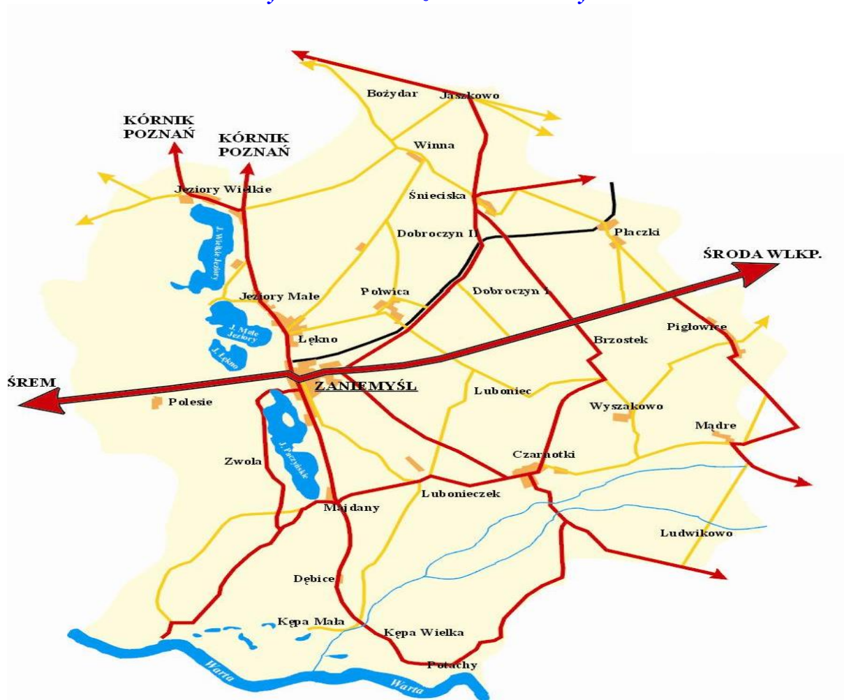
Rysunek 2.1. Położenie wsi Zaniemyśl

Położenie Zaniemyśla w Gminie przedstawia Rysunek 2.1.