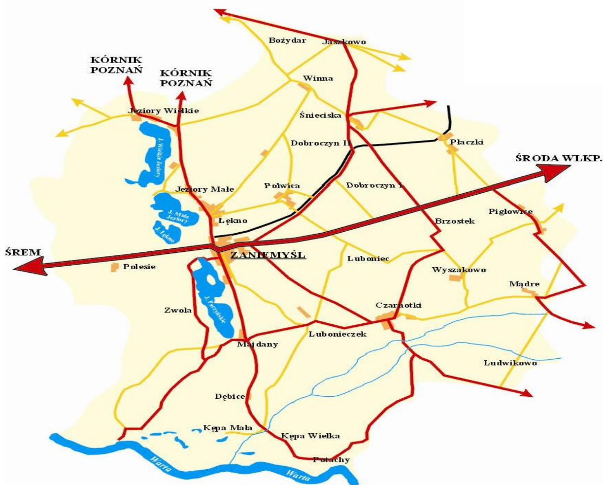
Rysunek 2.1. Położenie miejscowości Śnieciska

Na dzień 31.12.2015 roku w Śnieciskach było zameldowanych 438 mieszkańców. Położenie miejscowości Śnieciska w Gminie Zaniemyśl przedstawia Rysunek 2.1.