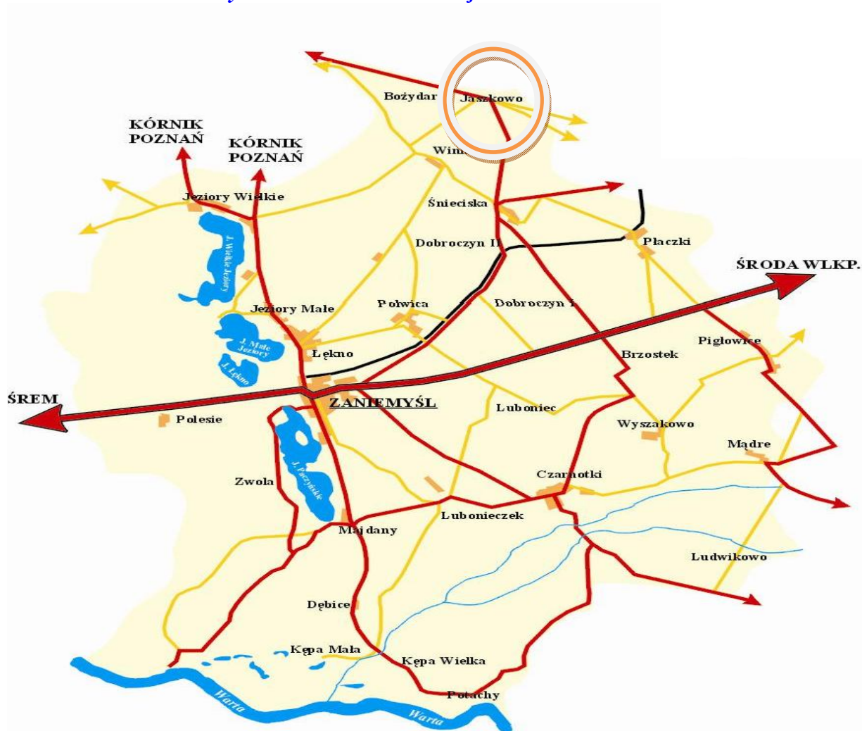
Rysunek 2.1. Położenie miejscowości Jaskowo

Na dzień 31.12.2017 roku w Jaskowie było zameldowanych 252 mieszkańców. Położenie miejscowości Jaskowo w Gminie Zaniemyśl przedstawia Rysunek 2.1.