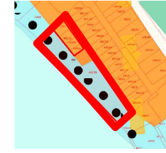
Teren objęty planem miejscowym